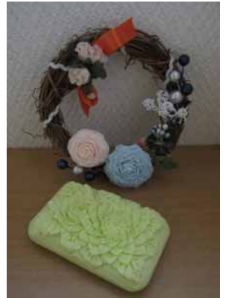
タイの伝統工芸 カービング 石鹸で作ってみました (大宮久美)