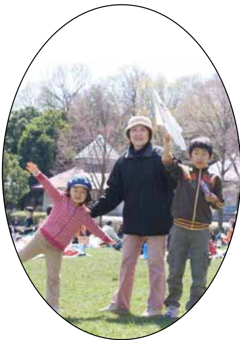
良い天気で気持ちいい こどもの国にて