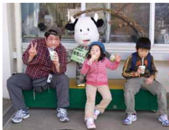
こどもの国の牛乳とアイス！おいしいよー