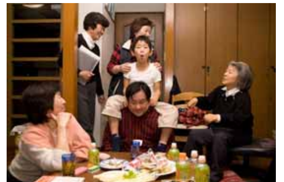
子どもがいると元気になるね