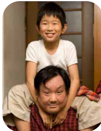
肩車って楽しいなあ～