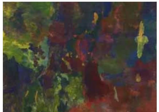
リョウヘイ作「水彩連盟展」に入選 木枯らし