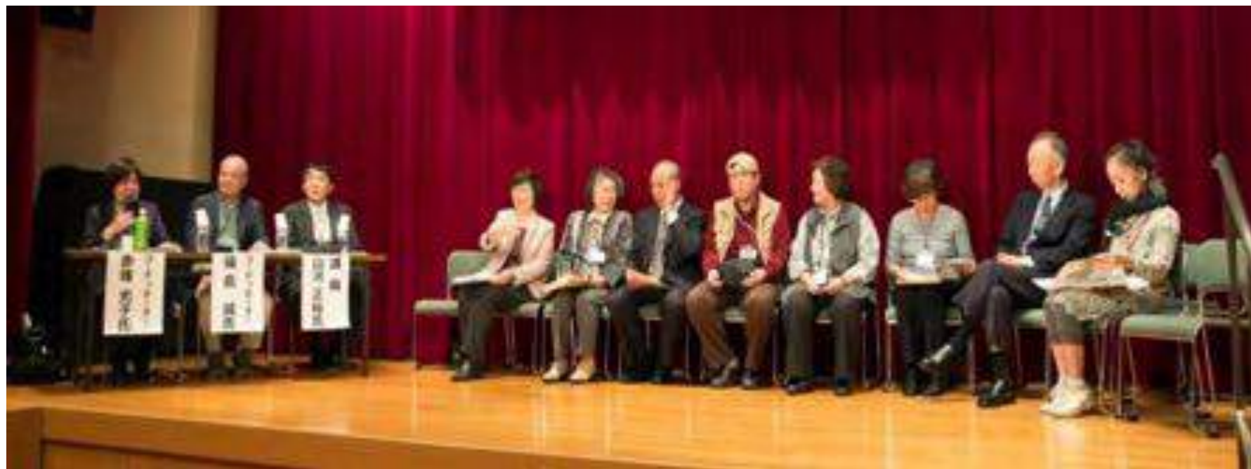
私たちの今、そしてこれから