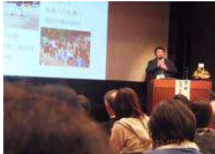
高次脳機能障害の生活支援