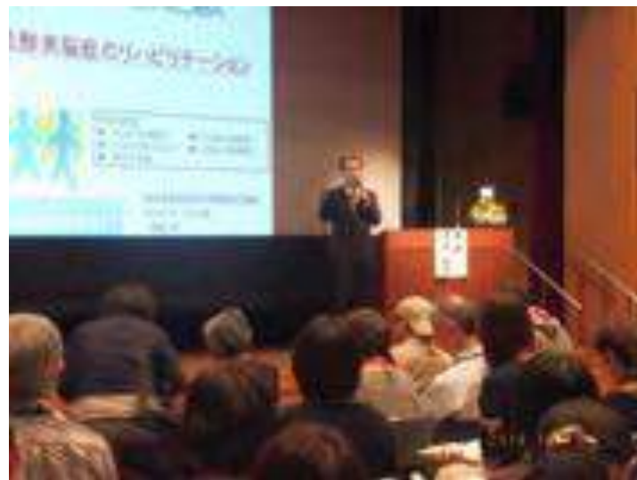
低酸素脳症のリハビリテーション